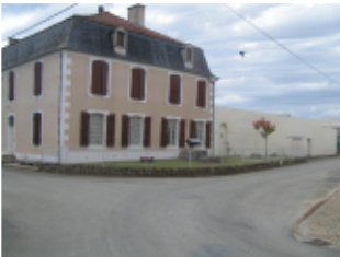
Ancien relais de diligences