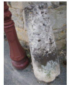
Chasse-roue ou bouteroue

A l'extrémité de cette rue, une tour d'angle appartenant à une ferme importante. Au pied de celle-ci, observez ces trois pierres disposées le long du mur, on les appelle des chasse-roues : elles empêchaient les charrettes de passer trop près du mur et de l'abîmer.