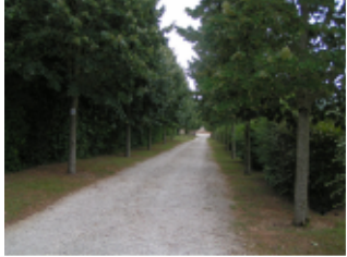
Chemin du départ qui conduit à l'église

Cette balade qui rejoint les deux communes d'Ardilleux et de Bouin peut être effectuée à pied ou en vélo. Le nom de la commune de départ viendrait du terme « Ardille » qui signifiait argile. Il nous rappelle que nous sommes sur des terres argileuses. Le circuit emprunte l'ancien chemin des diligences qui reliait Melle à Ruffec via Chef-Boutonne.