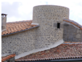
Tour de l'ancien château