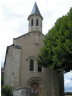
Eglise St-Junien, Ardilleux