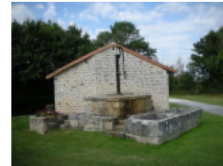
Puits de l'Aume