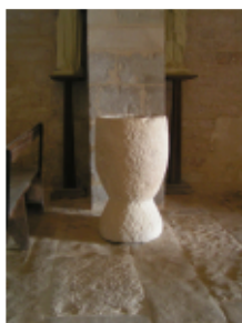
Très beau baptistère en forme de coquetier à admirer dans l'église de Bouin