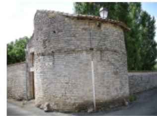
La tour d'angle de Bouin