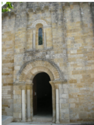
Façade de l'église romane de Bouin