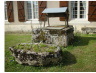
Puits à Ardilleux

La mémoire collective rapporte que les deux maisons que vous pouvez voir de chaque côté de la route étaient des anciens relais de diligences. Quand Louis XI institue le service des postes au 15 e siècle, on peut alors croiser des chevaucheurs transportant gratuitement deux fois par semaine le courrier en échange de privilèges. Au 18 e apparaîtront tout naturellement les relais de diligences. Ces relais, même modestes, devaient comprendre une écurie pour loger les chevaux et les malles, un fenil, un abreuvoir ou une mare et des prairies aux alentours. Mais, fin 19 e le cheval vapeur va gagner peu à peu les campagnes et faire progressivement disparaître ces modes de transport.