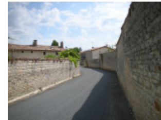
Rue typique de Bouin